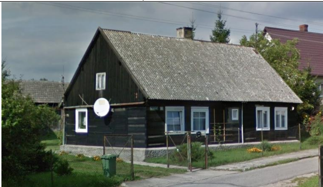
Źródło: Street View – wrzesień 2012 r.