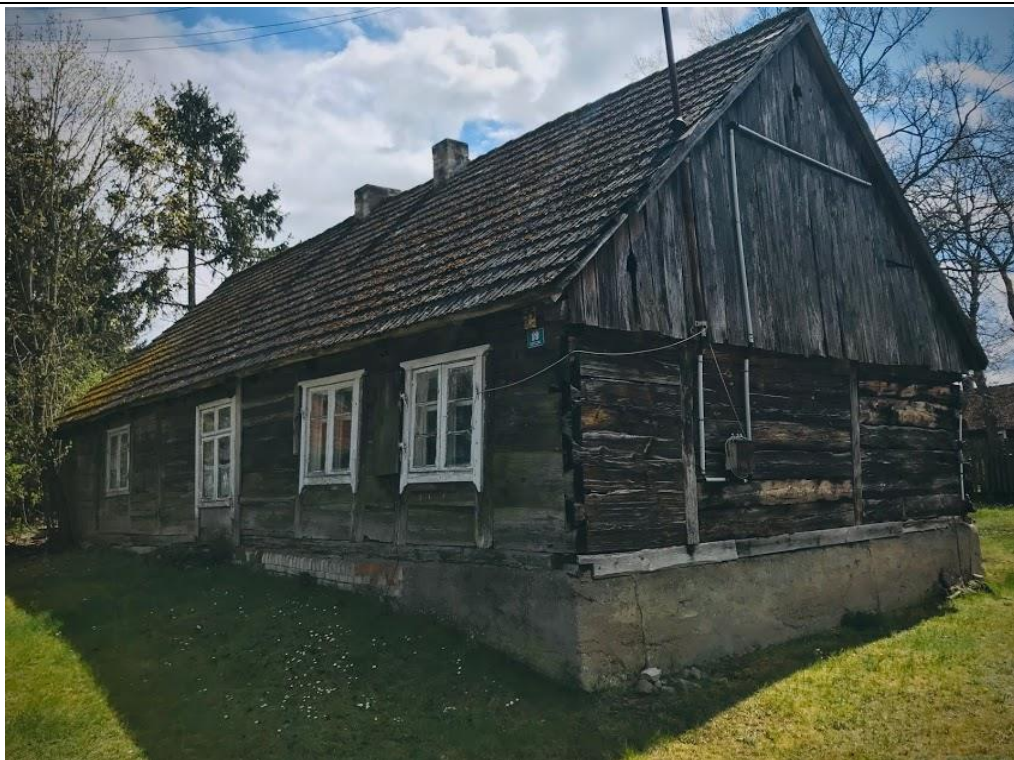
Elewacja frontowa, wschodnia