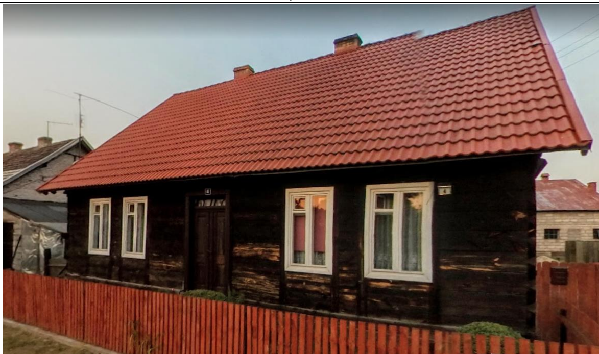
Źródło: Street View – wrzesień 2012 r.