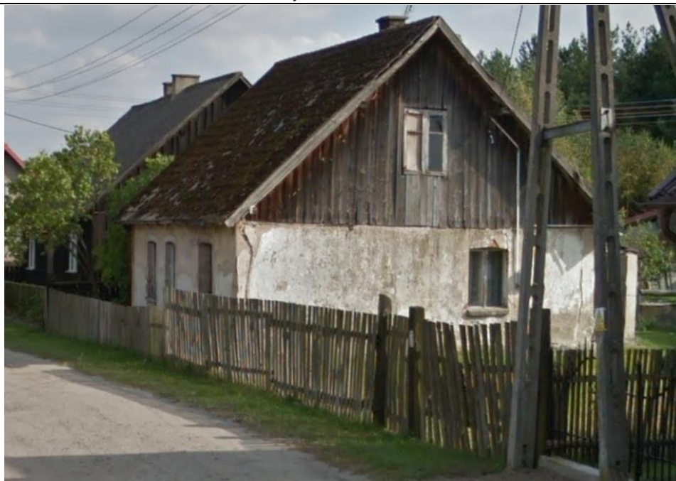
wrzesień 2012 r.