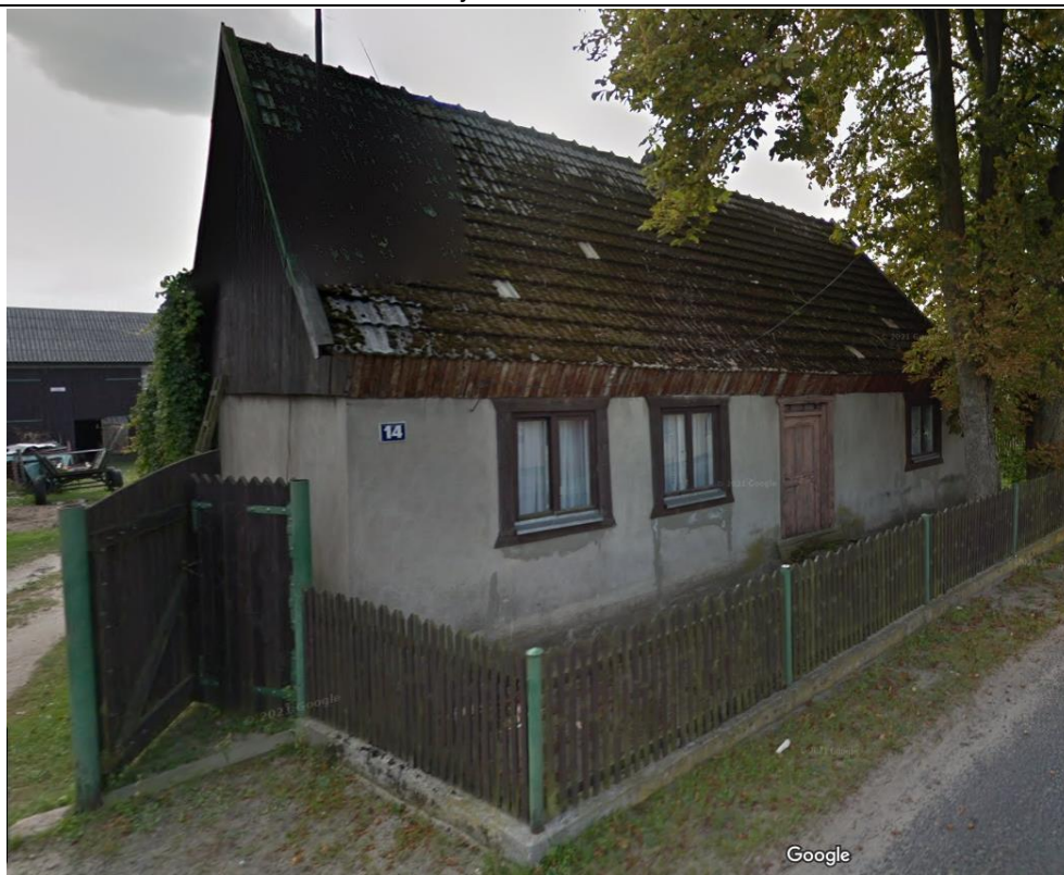
Źródło: Street View – wrzesień 2012 r.