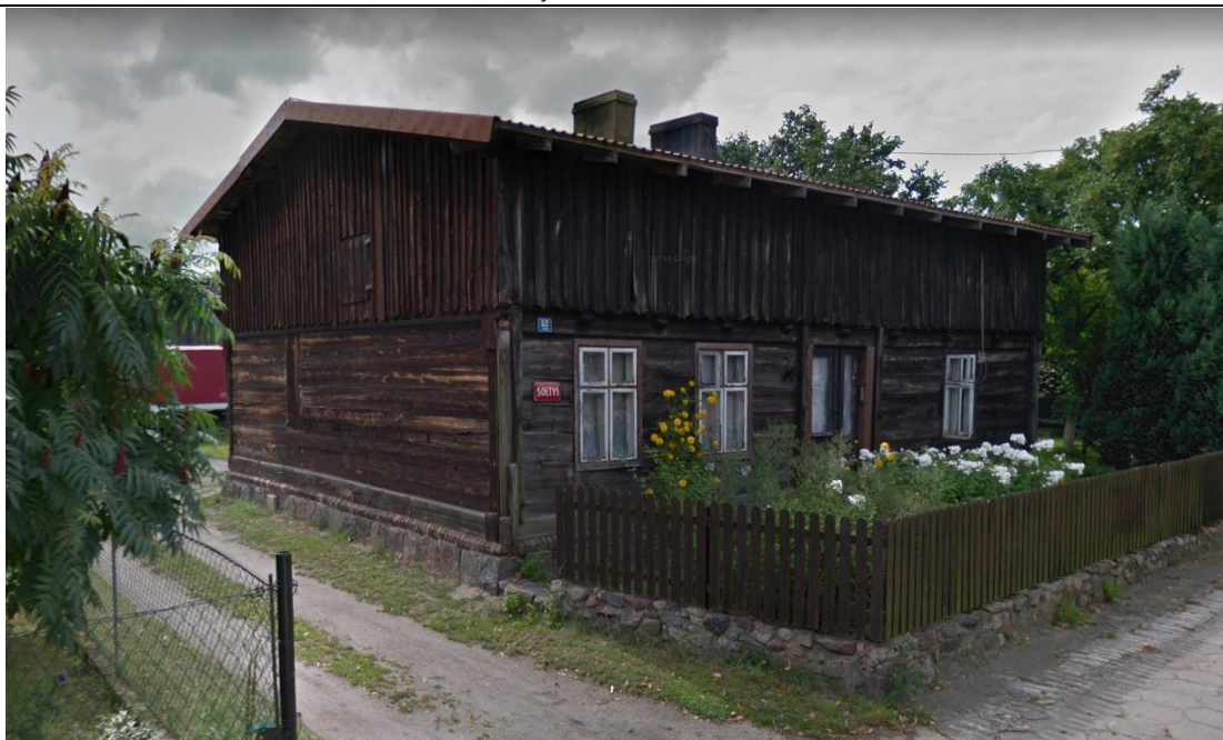
Źródło: Street View – wrzesień 2012 r.