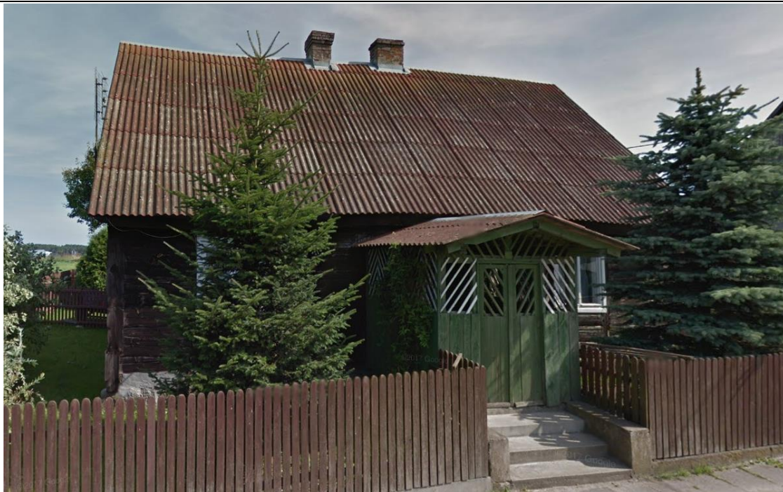
Źródło: Street View – wrzesień 2012 r.