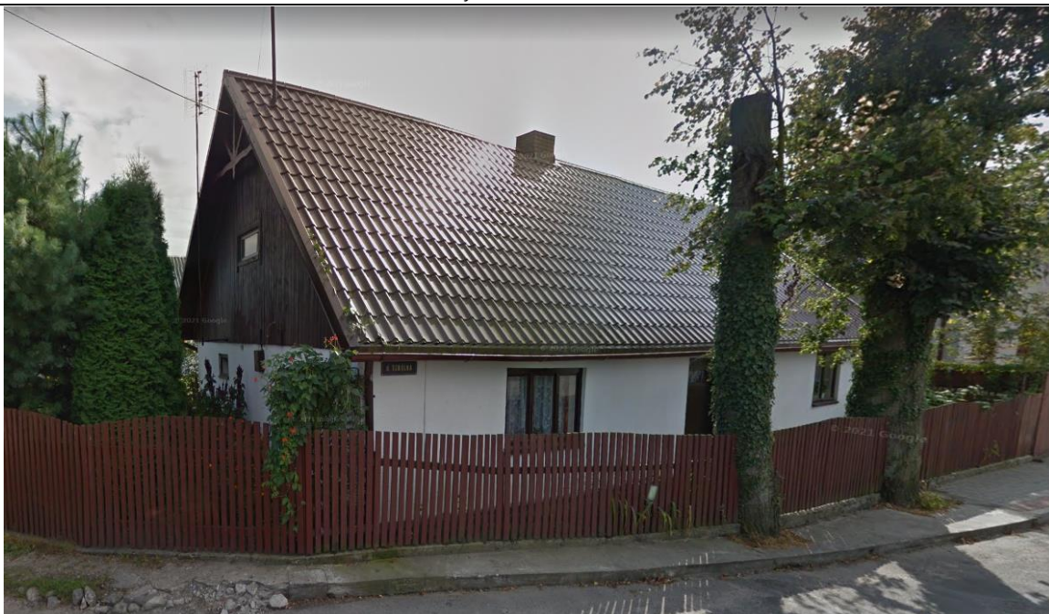
Źródło: Street View – wrzesień 2012 r.