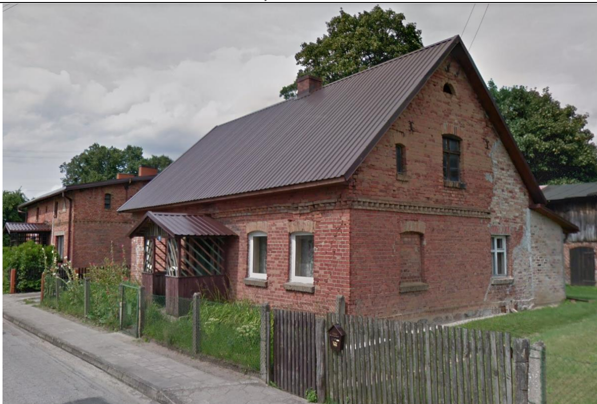
Źródło: Street View – wrzesień 2012 r.