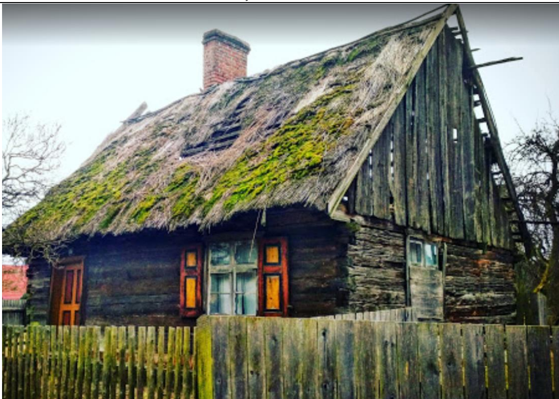
Źródło: Street View – wrzesień 2012 r.